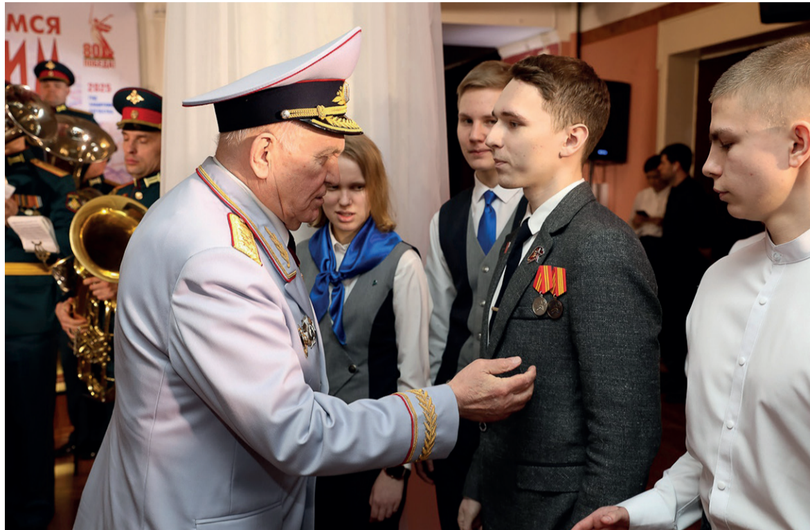
← Всего на Уроке Мужества награды получили 50 юных волховчан

— Мы, как представители социально ответственного бизнеса, стараемся вносить свой вклад в сохранение заводских традиций по патриотическому воспитанию подрастающего поколения. Молодые люди, которые получили сегодня знаки, несмотря на юный возраст, уже хорошо понимают, что хранить память о героях, гордиться их подвигами — это не пустые слова, а осознанная необходи-