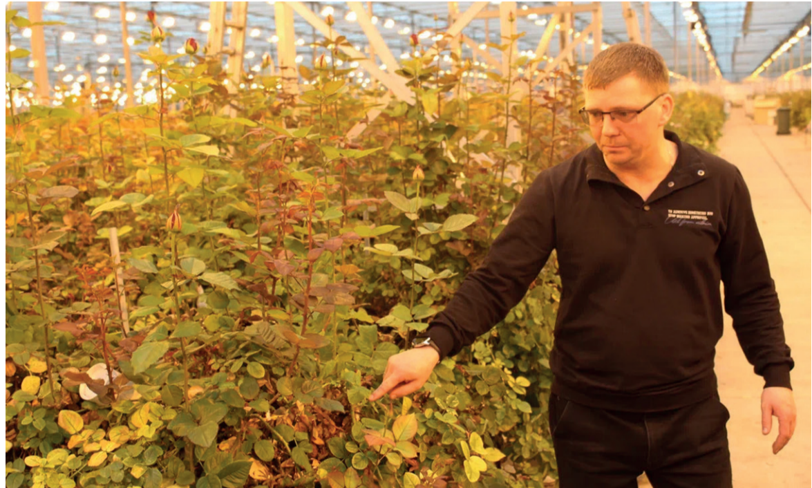
← Основные рынки сбыта продукции АО «Новая Голландия» — Москва, Санкт-Петербург и южные регионы России

Для привлечения сотрудников компания регулярно проводит различные профориентационные мероприятия. Например, при взаимодействии с Кадровым центром организуются так называемые «Недели без турникетов», когда предприятие посещают группы школьников и студентов. Ребятам подробно рассказывают об особенностях и преи-