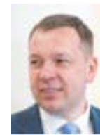
ФЁДОР СТУЛОВ, ПРЕДСЕДАТЕЛЬ КОМИТЕТА ПРИРОДНЫМ РЕСУРСАМ ЛО

Ленинградская область не первый год помогает ДНР. Мы уже отправили больше 1,3 миллиона семян сосны, высаженных на пострадавших территориях. Совместная долгосрочная программа поддержки рассчитана на восстановление 170 га леса, повреждённого за последние годы. Помогая коллегам, Ленинградская область и свои планы по лесовосстановлению выполняет с опережением.