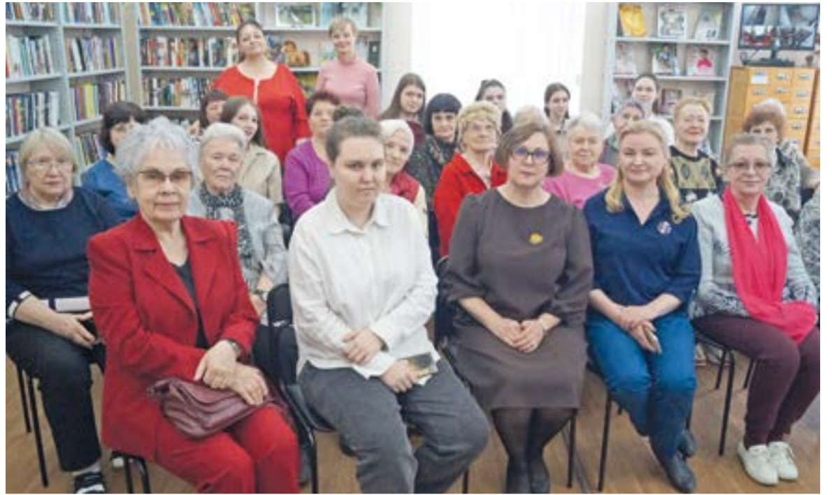
↑ В отечественной истории есть немало выдающихся женских имён. Поэтому недостатка тем для Гризодубовских чтений не ожидается

Прозвучали интересные факты и о самой Валенти-