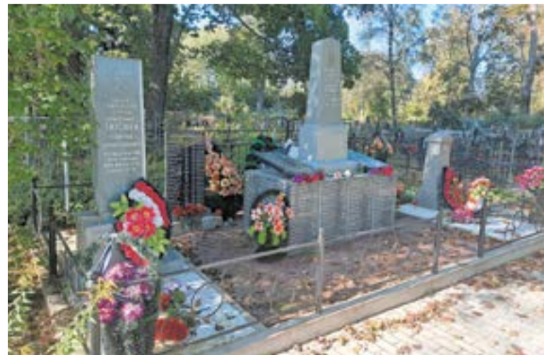
Могила Героя Советского Союза лётчика С.А. Титовки