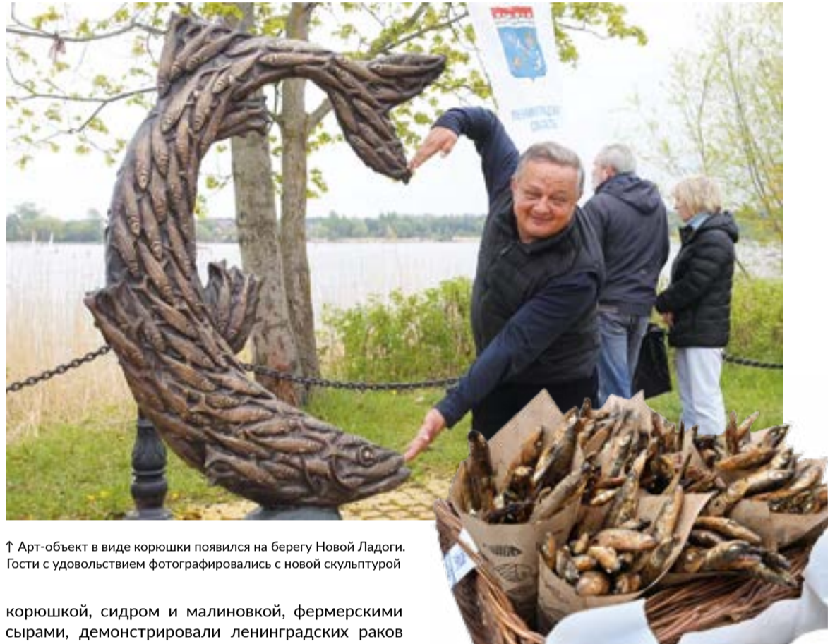
↑ Арт-объект в виде корюшки появился на берегу Новой Ладogi. Гости с удовольствием фотографировались с новой скульптурой

Отведать рыбку с ароматом огурца смогли и иностранные гости. Послы дружественных государств: Кубы, Вьетнама, Лаоса, Абхазии, Китая, Таиланда, Руанды и Монголии впервые побывали в Новой Ладоге. Экскурсию по гастрономическим изыскам региона для них провёл губернатор Александр Дрозденко. Послов угощали жареной