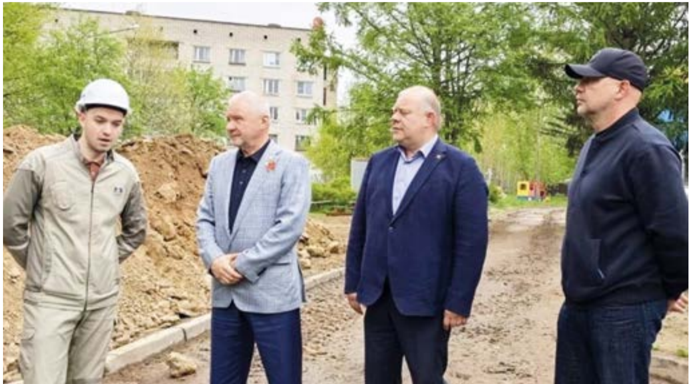
↑ Капремонт детского сада № 1 «Дюймовочка» реализуется в рамках программы комплексного развития территории Волхова. Садик планируют открыть к сентябрю 2027 года