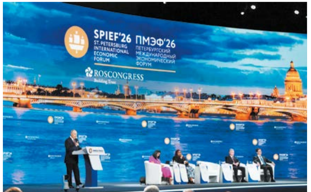
Кульминацией ПМЭФ стало пленарное заседание с участием президента России Владимира Путина

Это позволяло максимально прочувствовать дух региона, или, как сейчас модно говорить, вайб. В центре выставки, среди зелёных насаждений и удобной коворкинг-зоны, возвышался маяк. А как иначе? Этот арт-объект давно стал нашим символом. «Живи и работай в Ленинград-