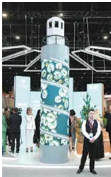
Главный образ экспозиции 47-го региона — Маяк

Открытие нового завода компании «ЕвроХим» в Кингисеппе запланировано на третий квартал этого года. После выхода на полную мощность комплекс станет производить до 1,4 млн тонн карбамида и 1,1 млн тонн товарного аммиака.