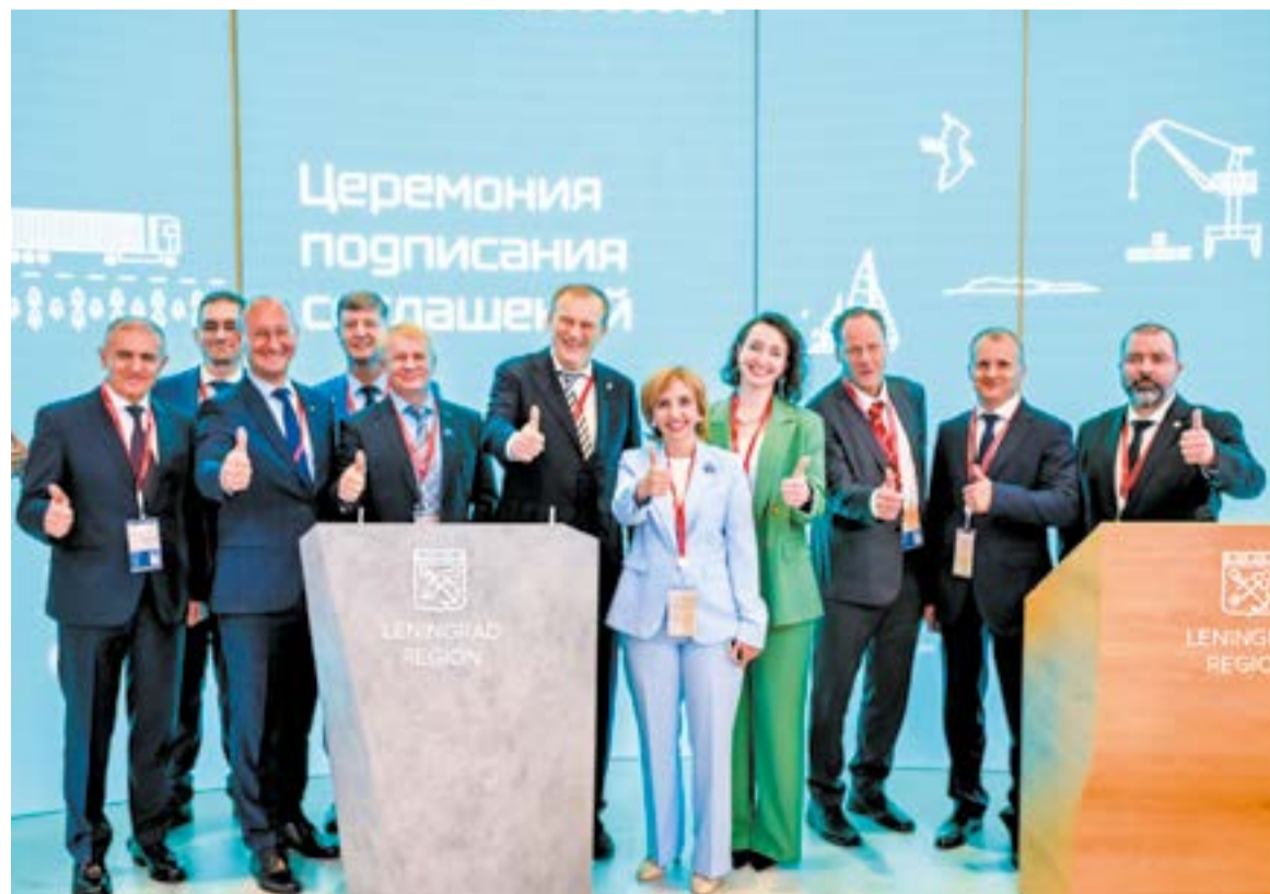
На ПМЭФ-2026 Ленобласть заключила соглашений на сумму 314 млрд рублей

ИРЭН ОВСЕПЯН