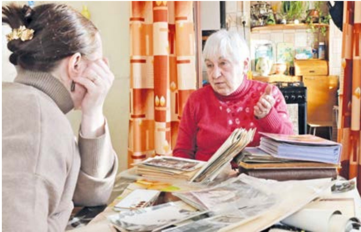
↑ Процесс работы команды «Николаевского проспекта» над выставкой «Бремя наследия». Запись воспоминаний

руководитель проекта #ДОМ17, директор автономной некоммерческой организации «Николаевский проспект»