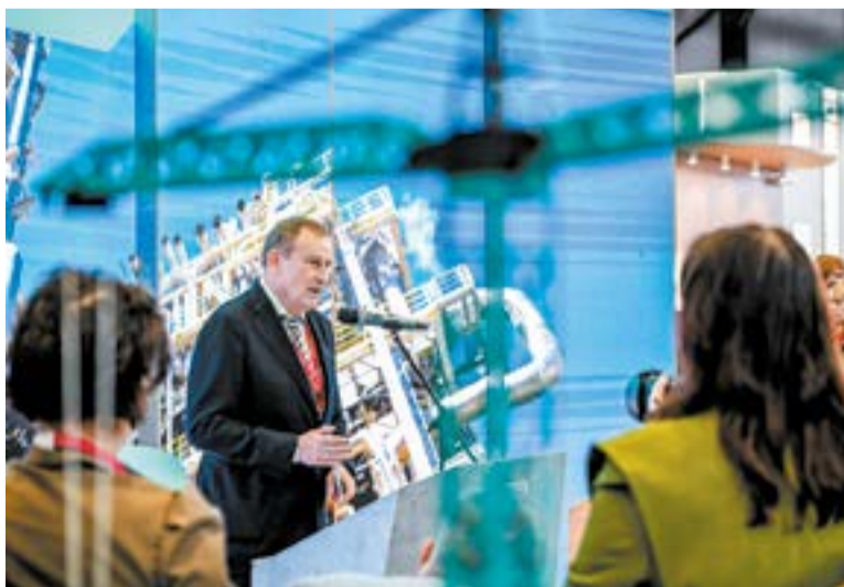
Александр Дрозденко: «Меня радует, что уже в рамках нынешнего форума мы заложили потенциал и на ПМЭФ-2027»

Петербургский экономический форум посетил глава Федеральной комиссии по изящным искусствам США Мимс Кук. В кулуарах говорили о том, что его визит на форум «благословил» сам Дональд Трамп. Первые за последние несколько лет на форум приехали представители Германии и Франции, которые осторожно нащупывали почву для дальнейшего сотрудничества. Образно говоря,