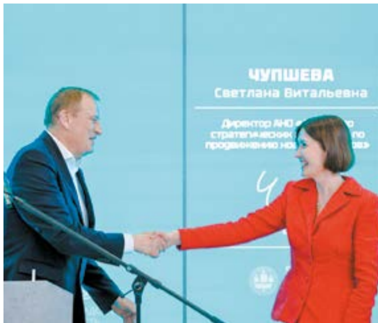
В рамках соглашения с АСИ планируется реализация региональных мер по народосбережению и поддержке семей

ный комплекс на 2350 номеров, объекты досуга и активного отдыха. В строительство предполагается вложить 15,1 млрд рублей.